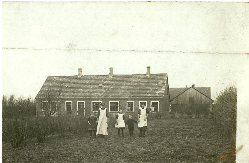
Den nye gård, ca. 1904-5

Dagen efter branden kunne man læse følgende i dagens avis, her fra Aalborg Stiftstidende, men beretningen i Aalborg Amtstidende er nogenlunde den samme. Artiklen er skrevet med "krøllede" bogstaver og er derfor "oversat"