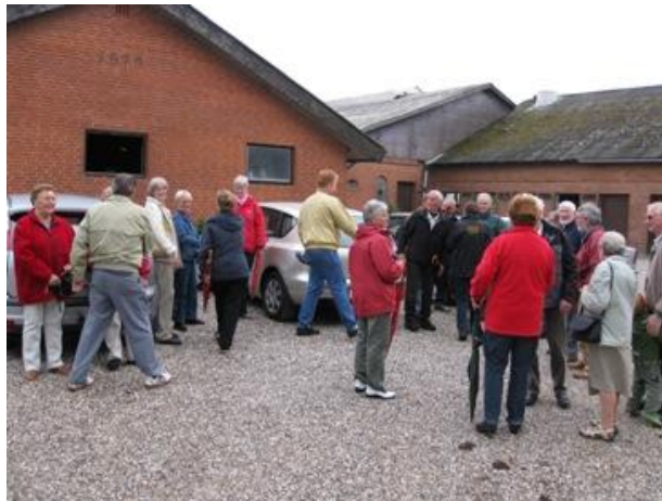
Fra byvandringen på Fjelleradgård

om nutidens ko-hold. Efter rundvisningen var der kaffe i konfirmandstuen i Gunderup.