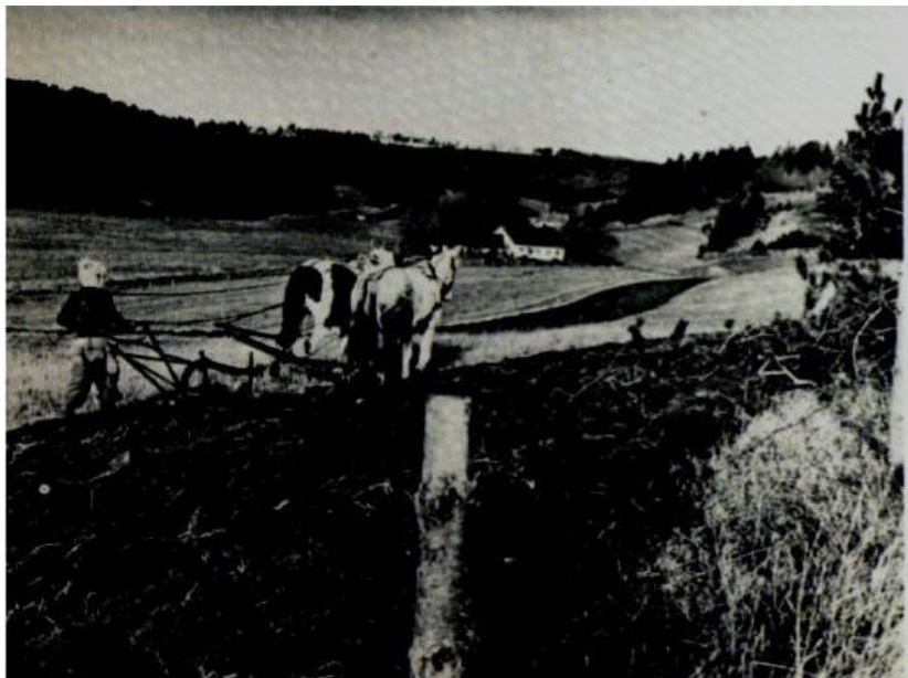
Efterårspløjning i Borredal i 40'erne